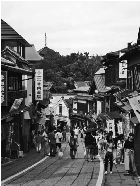
写真1 新勝寺へ続く参道

日本の経済にとっていかに重要な港であるかがわかります。さらに古くから成田市を有名にしているものに成田山新勝寺があります。新勝寺は JR 成田駅から ( う ) の方向にあり、940 年に開山された寺で 1000 年以上の歴史があります。② 成田市はこの新勝寺とともに発展してきたと言えるでしょう。正月三が日には 300 万人ほどの人出があり、初詣客数で東京の明治神宮とトップを争う全国屈指の寺です。年間を通して多くの観光客が訪れますが、成田国際空港に近いことから日本人だけではなく、③ 外国人観光客が多いことも特徴の一つです。そのため、観光案内所では日本語のパンフレット以外に韓国語、英語、スペイン語など 外国語のパンフレットを作成し、外国人観光客の受入態勢を整えています。