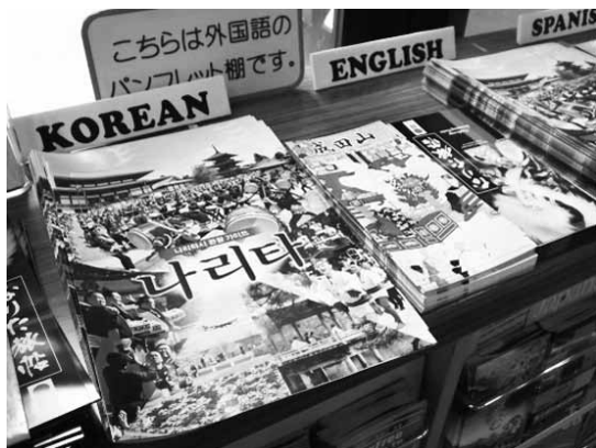
写真2 外国人向けパンフレット