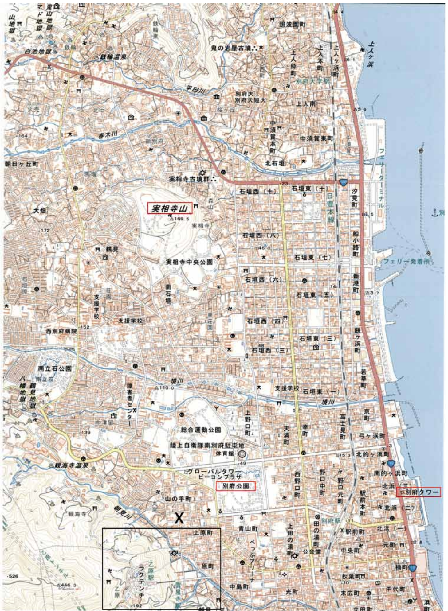
【地図1 大分県別府市の市街地（地理院地図より25000分の1の地形図を拡大したもの）】