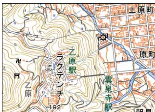
【地図2 地図1中のXの範囲】