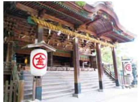
【写真1 金刀比羅宮本宮】

丸亀市が全国に誇るものとして「丸亀うちわ」があります。江戸時代初期につくられるようになり、その後丸亀藩の下級武士の内職となり、金刀比羅宮参りのおみやげとして全国に広まっていきました。「丸亀うちわ」は江戸時代から続く400年の歴史や技術、地元の原材料を使って製造していることから1997年には国の伝統的工芸品に指定されています。また、全国のうちわの9割は丸亀で生産されています。高度な技術を持つ職人が竹で作ったうちわは暖かみがあると言われ、人気があります。しかし、うちわのような伝統工芸品の製造には近年課題が発生しています。それは② 1960年代をピークに生産量が大きく減少していること です。日本一の生産量を誇る丸亀市でも丸亀うちわの伝統が危機におちいつているのが現状です。そのため、丸亀市では若い職人を育てることに力を注いでいます。また、自分の国にあまり産業がない外国の人にうちわ作りの技術を教えるなど、海外にも丸亀うちわを広げようという動きも見られます。