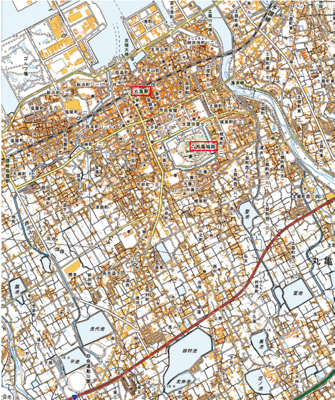
【地図1 2万5千分の1地形図 丸亀】